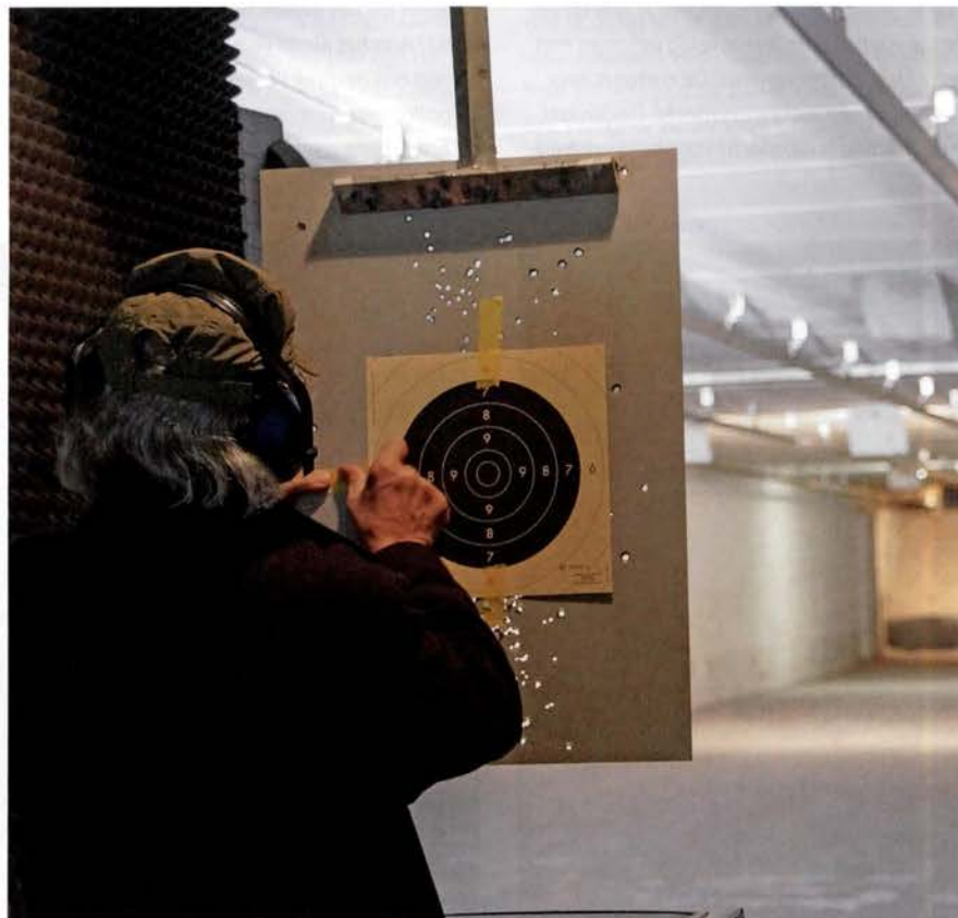
Kaartenwissel onder toezicht van David Hendrik Baron Chassé

David Hendrik Baron Chassé (Tiel 18 maart 1765 - Breda 2 mei 1849) was een Nederlands officier. In 1781 nam hij dienst bij het Staatse leger. Hij week na de onderdrukking van de Patriottenopstand in 1787 uit naar Frankrijk, waar hij opklom tot luitenant-kolonel in het Bataafs Legioen. Chassé speelde in 1799 een belangrijke rol bij het terugslaan van de Engels-Russische invasie in Noord-Holland. Hij streed ook in dienst van Napoleon in de verschrikkelijke guerrillaoorlog in Spanje (1808-1812) en werd wegens zijn verdiensten daarbij in 1810 verheven tot baron. Hij werd vervolgens bevorderd tot divisie-generaal in Franse dienst. Vanwege zijn voorliefde voor het gebruik van de bajonet noemde Napoleon hem wel 'Général Baïonette'. In het Amsterdamse stadsdeel De Baarsjes zijn een straat, een buurt en een kerk naar hem vernoemd. De kerk, de Chassékerk, is niet meer in gebruik. In Breda is een stads-singel, de voormalige Chassékazerne en het Chassé Theater naar hem vernoemd. Ook in Den Haag is een straat naar hem vernoemd en in Tiel is er een schietsportvereniging naar hem vernoemd.