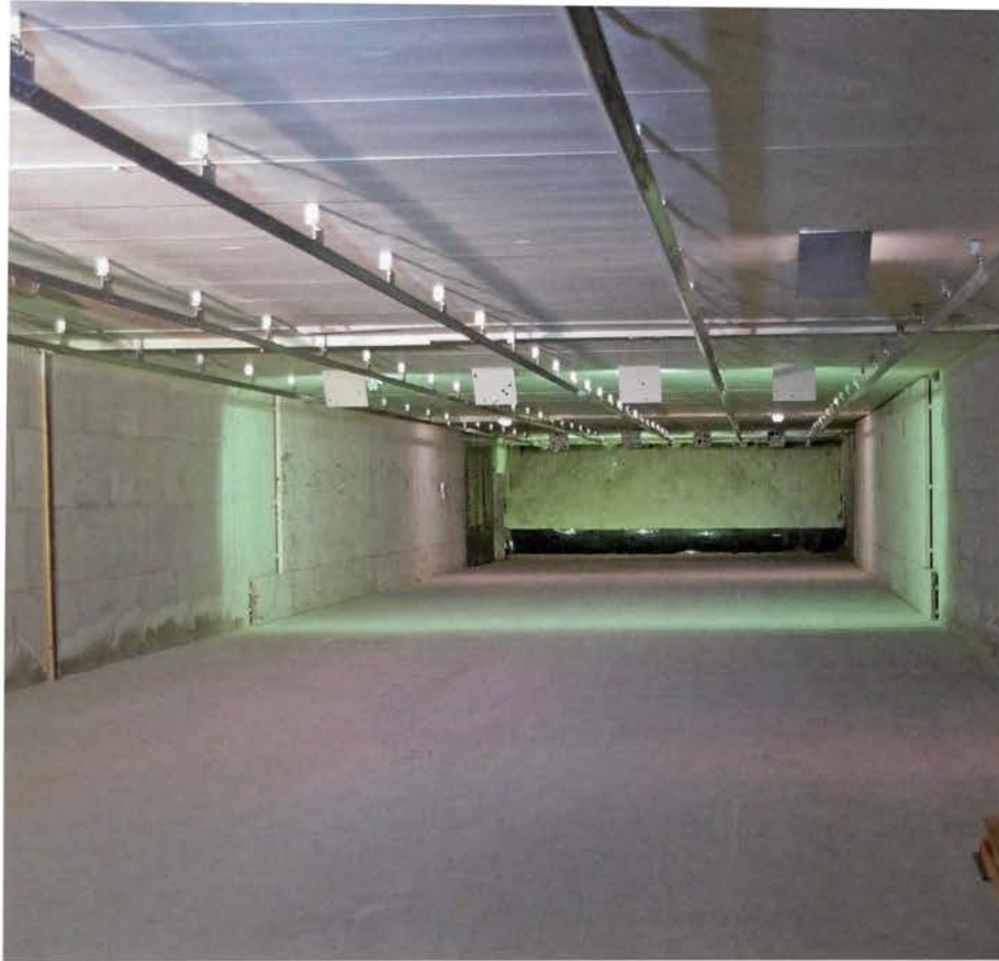
De 10 schietbanen waarop vele KNSA-disciplines geschoten worden