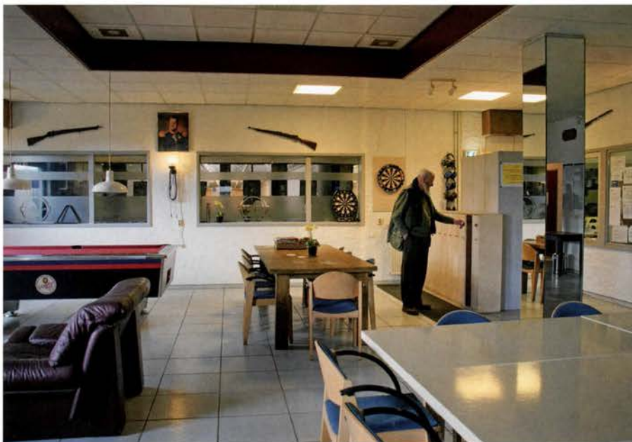
Een blik op de ruime kantine

4) Gedurende de periode van het aspirantlidmaatschap wordt er naar je gekeken. Je wordt beoordeeld op veiligheid en of je verantwoord omgaat met de wapens en munitie. Maar eventueel ook aan de bar. Ben je een sociaal persoon die het gezelschap van medeschutters zoekt? Aan het einde van deze periode kan dan alsnog een gesprek volgen. Dit gesprek is met de ballotagecommissie. De ballotagecommissie brengt een advies uit aan het bestuur en het