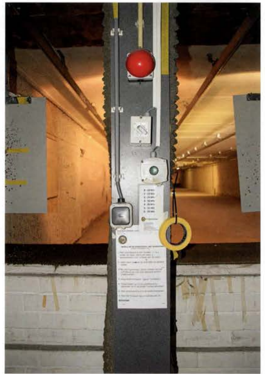
De instelapparatuur voor 10, 12, 15, 25 en 50 meter